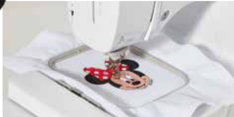
Champ de broderie de 100 x 100 mm