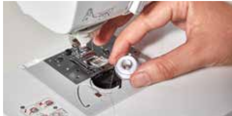
Mise en place rapide de la canette